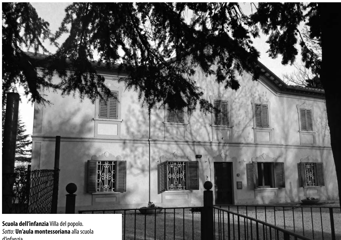
Scuola dell'infanzia Villa del popolo. Sotto: Un'aula montessoriana alla scuola d'infanzia.