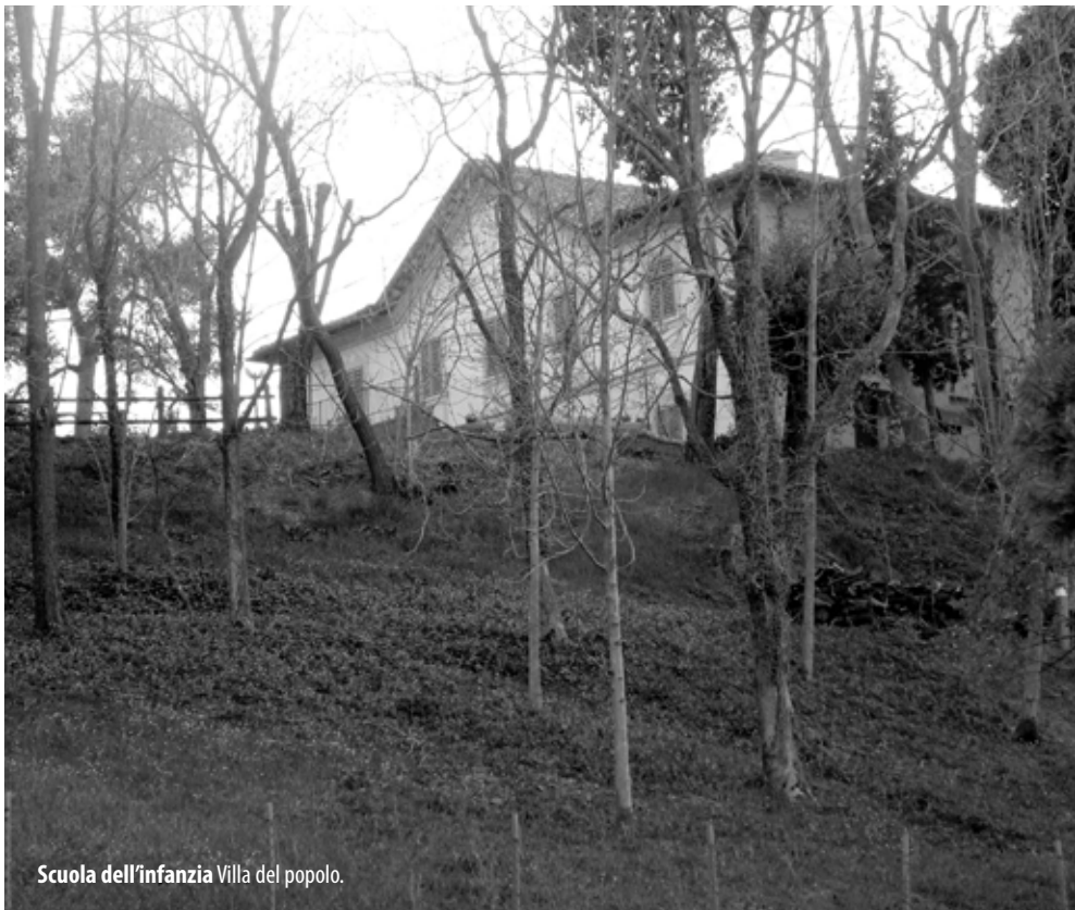
Scuola dell'infanzia Villa del popolo.

Il comitato spontaneo di genitori che ha cercato di sollecitare l'Istituto comprensivo in questa direzione, nonostante abbia raccolto un certo consenso e abbia lavorato con generosità e fiducia, alla fine ha perso la partita. Il primo errore è stato cadere nella trappola di facebook, nell'abbaglio che il social network possa essere un ambito di dialogo e coordinamento, mentre si è rivelato per quello che effettivamente è: una dimensione totalmente