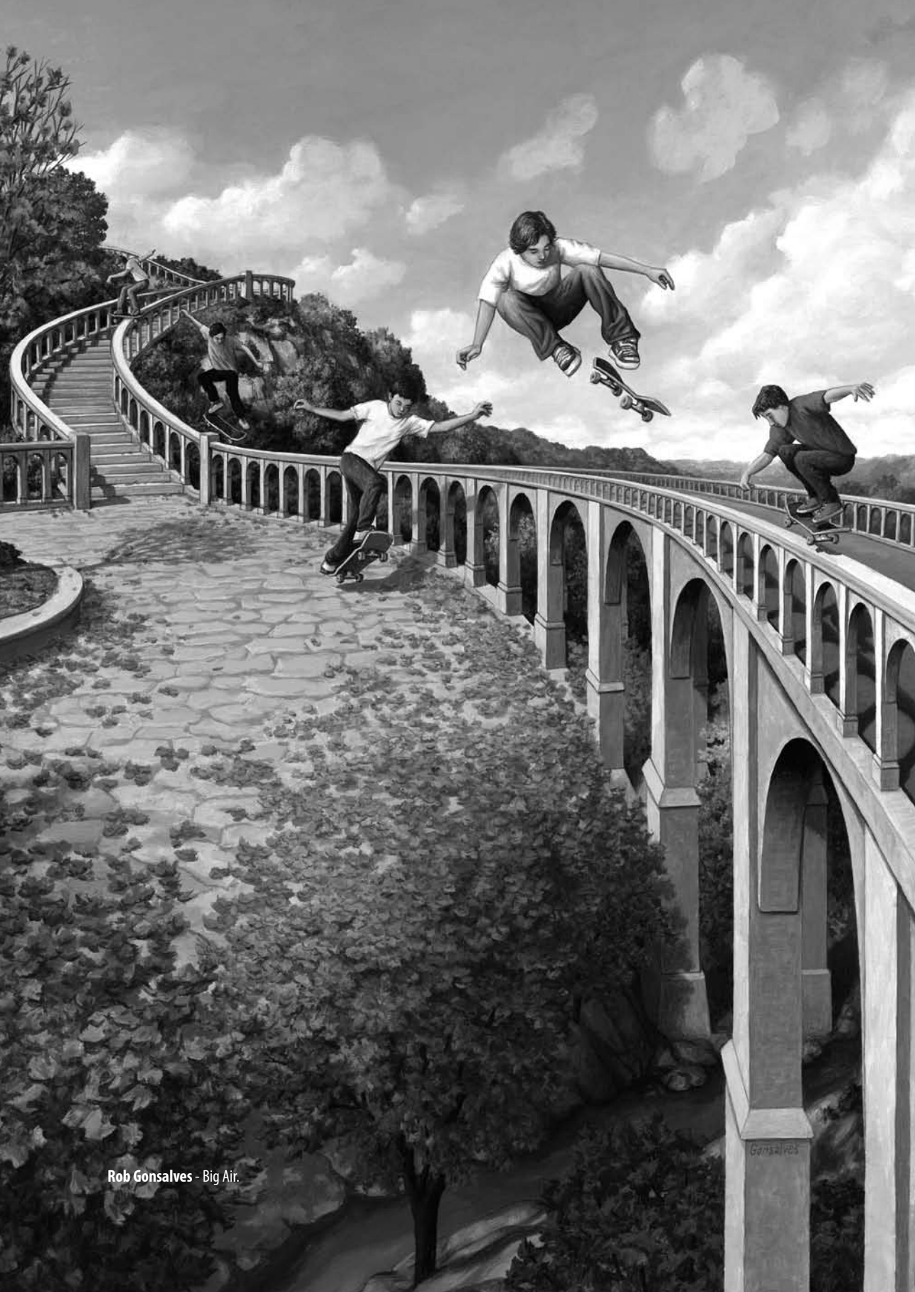
Rob Gonsalves - Big Air.