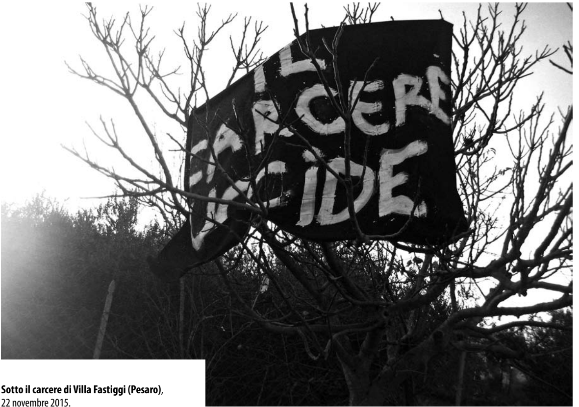
Sotto il carcere di Villa Fastigi (Pesaro), 22 novembre 2015.