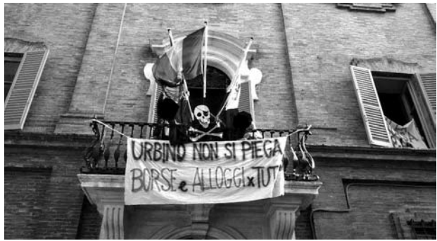
Sopra: Manifestazione studentesca a Urbino , 21 ottobre 2013.