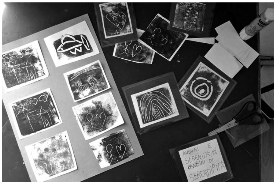
Auguri e serenita dai bambini di Serendipita, Natale 2015

che frequentava un nido tradizionale, ho avuto modo di vederne tutte le criticità e le problematicità.