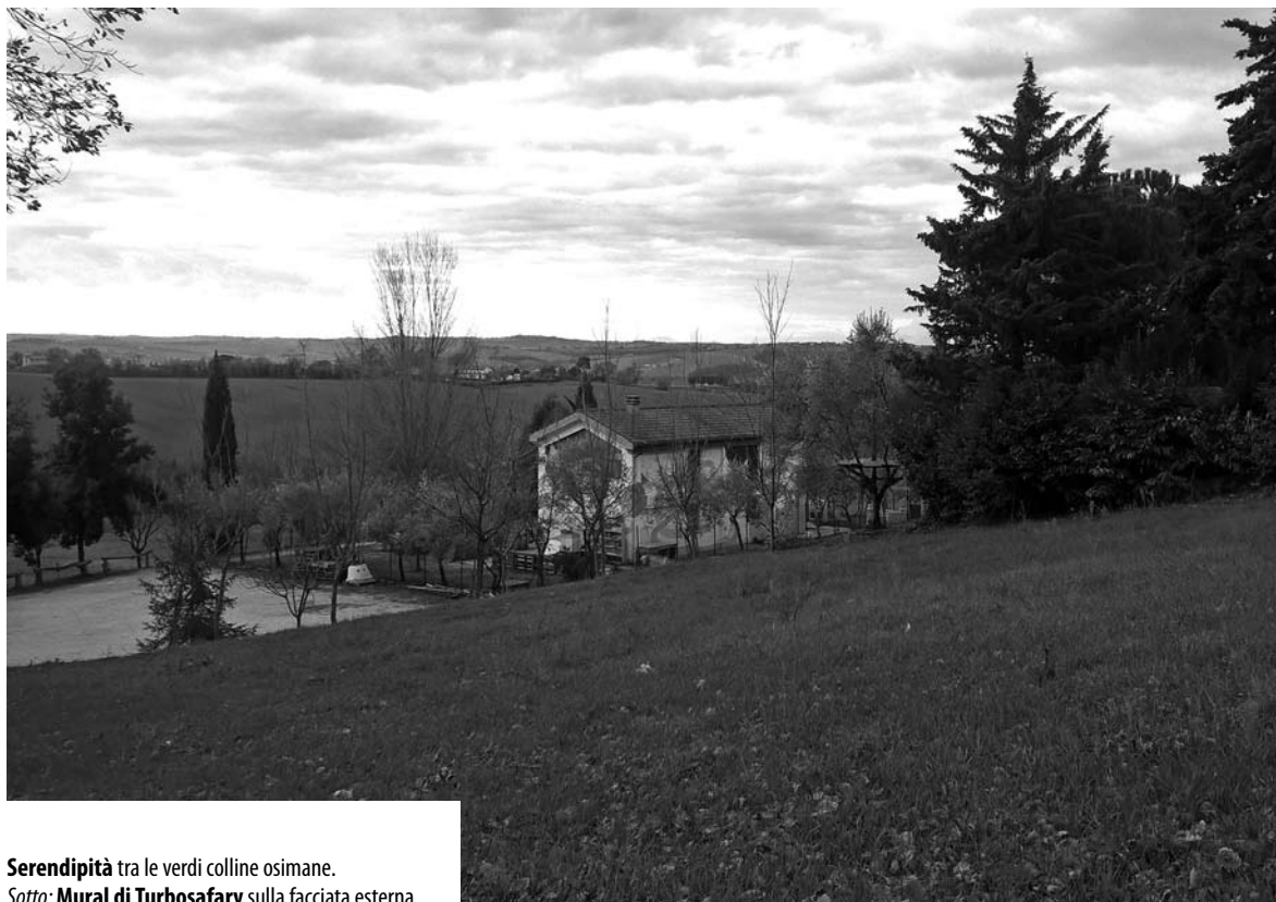
Serendipità tra le verdi colline osimane. Sotto: Mural di Turbosafary sulla facciata esterna.