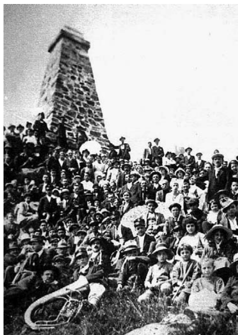
Obelisco a Fra Dolcino del 1907.

mericamente non troppo rilevante e piuttosto disperso nel territorio della Marca. Interessanti sono i modi con cui vengono dipinti dal potere della chiesa: pauperculos pediculosos (poveri pidocchiosi), eretici e lussuriosi, depravati, dediti a turpi riti, atti a compiere orge notturne; se nasceva qualche bambino era d'uso l'infanticidio, il corpo bruciato e le ceneri mischiate al vino da far bere ai seguaci.