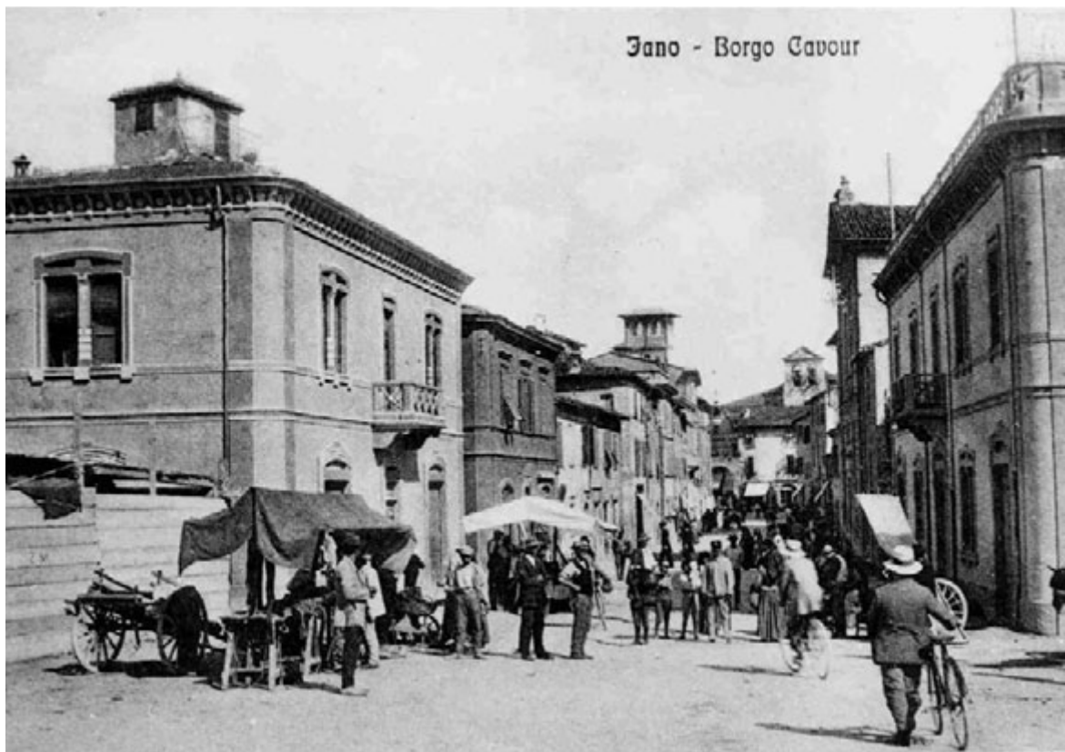
Vecchia Fano - Borgo Cavour (sopra) e Corso V. Emanuele (sotto).