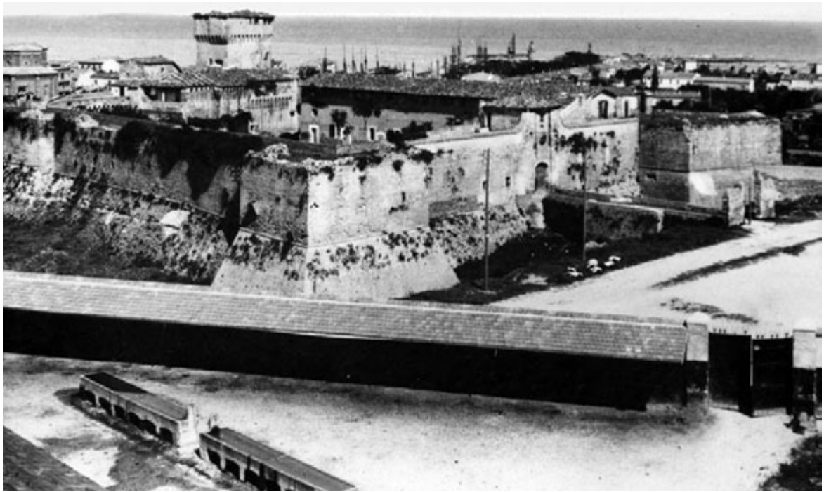
Vecchia Fano - Rocca Malatestiana (sopra), Via San Francesco (a lato).