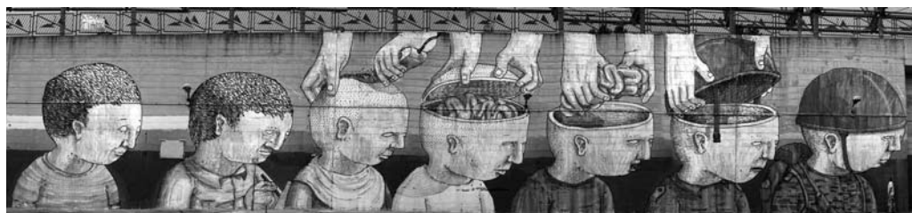
Blu - Street art, Campobasso.

versità alla disciplina e all'alto dovere che stanno compiendo" 2 . Secondo il codice penale militare, art. 114, "sono considerati rei di rivolta i militari che, in numero di quattro o più, rifiuteranno, essendo sotto le armi, di obbedire alla prima intimazione dei loro superiori, ovvero prenderanno le armi senza essere autorizzati ed agiranno contro gli ordini dei loro capi. Gli agenti principali saranno puniti con la pena di morte e i loro complici andranno soggetti alla pena della reclusione militare da tre a dieci anni".