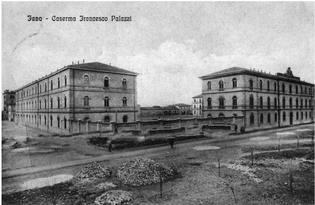
Fano , Caserma Francesco Palazzi, 1912.

Da queste righe emergono due elementi particolarmente interessanti. Il sentore di una certa premeditazione della protesta da parte dei soldati e la presenza di civili radunatisi per un saluto ai partenti. Donne e bambini di certo non erano andati a sventolare bandierine tricolori né a intonare inni patriottici. Nel 1917 l'insofferenza popolare nei confronti della guerra, non contenuta dalla rassegnazione, si andava traducendo in sempre più frequenti episodi di ribellione. Le manifestazioni di protesta sociale si estendevano di pari passo al crescente logoramento provocato da una guerra di cui non si vedeva la fine, originando una serie di agitazioni, tumulti ed episodi di lotta culminati nell'insurrezione di popolo, scaturita dalla mancanza di pane e farina, che sconvolse Torino nell'agosto 1917. Alle difficoltà oggettive delle condizioni di vita e di lavoro si sommava la netta sensazione di stare subendo un'ingiustizia, visto che chi sopportava i disagi e pagava i costi umani della guerra "patriottica" erano, come sempre ed esclusivamente, le classi popolari.